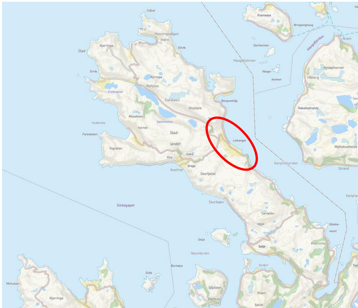
Figur 1: Leikanger i Stad kommune.

Med heimel i plan- og bygningsloven (pbl.) §§ 12-1 og 12-8 blir det varsla oppstart av reguleringsplanarbeid for etablering av indre hamn med ein molo ved Leikanger på Stadlandet. Planen vil utarbeidast som detaljreguleringsplan, jf. pbl. § 12-3.