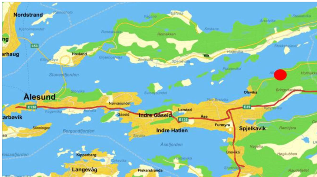
Figur 1 Tiltakets lokalisering markert med rød sirkel

Planområdet ligger i Alvika i Ålesund kommune. Området er markert med rødt.