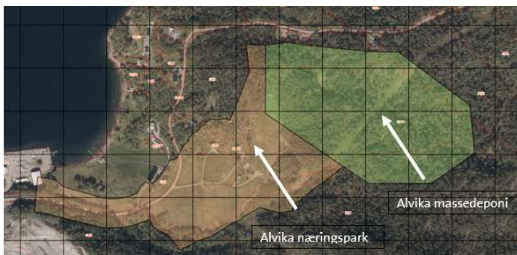
Figur 3 Viser areal til reguleringsplan for Alvika massedeponi og Alvika næringspark. Regulert tilkomstveg til Alvika massedeponi, inngår i planområdet til Alvika næringspark. Tilkomstvegen skal reguleres ihht. gitt dispensasjon og som bygd.