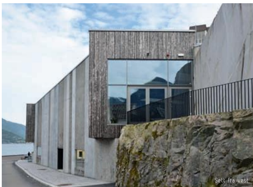
Sett fra vest

Vegger mot terreng er fjell skåret ut av bergknausen, og hovedbærevegger er frittstående, utskårne fjellskiver. Fjellet består av granittisk gneis og har lyse farger med vakre tegninger.