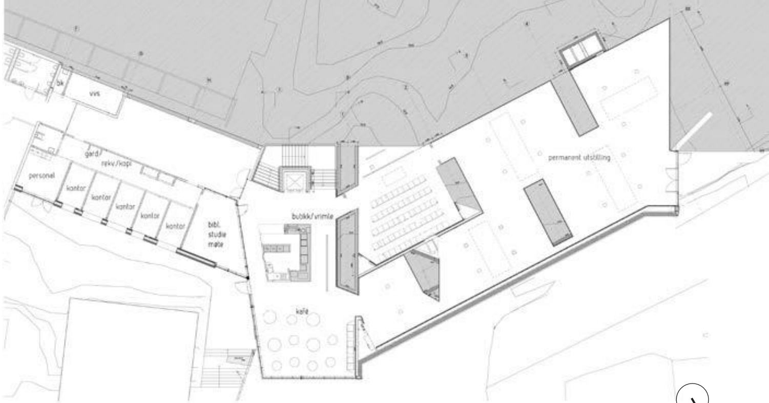
Plan 2. etasje. Kontordel er plassert i eksisterende bygningsmasse og ble ferdigstilt sammen med nybygget