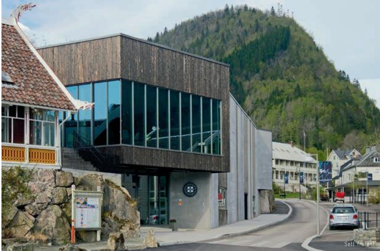
Sett fra øst