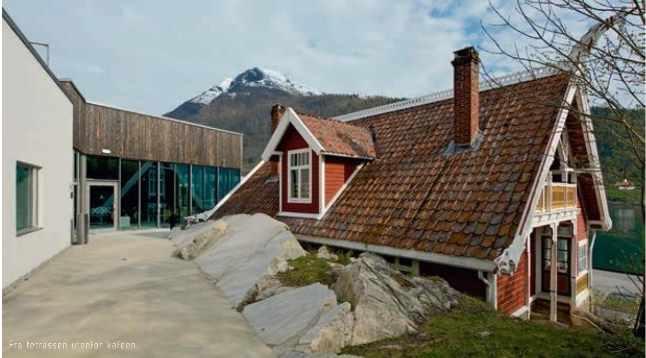
Fra terrassen utenfor kafeen