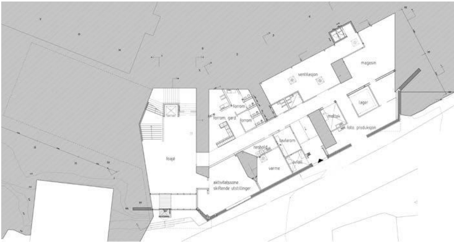
Plan 1. etasje