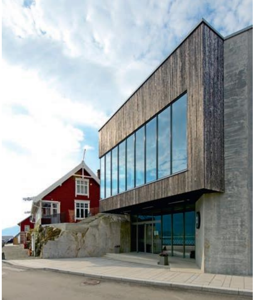
Hovedinngangen mot nordøst

Himling i utstillingsarealer er i lys, plateforsalet betong. Mellom hovedbære- veggene er det overlys som dramatiserer opplevelsen av utstillingsrommet og de bærende fjellveggene. Overlysene dannes av konstruktivt bærende betongdragere på