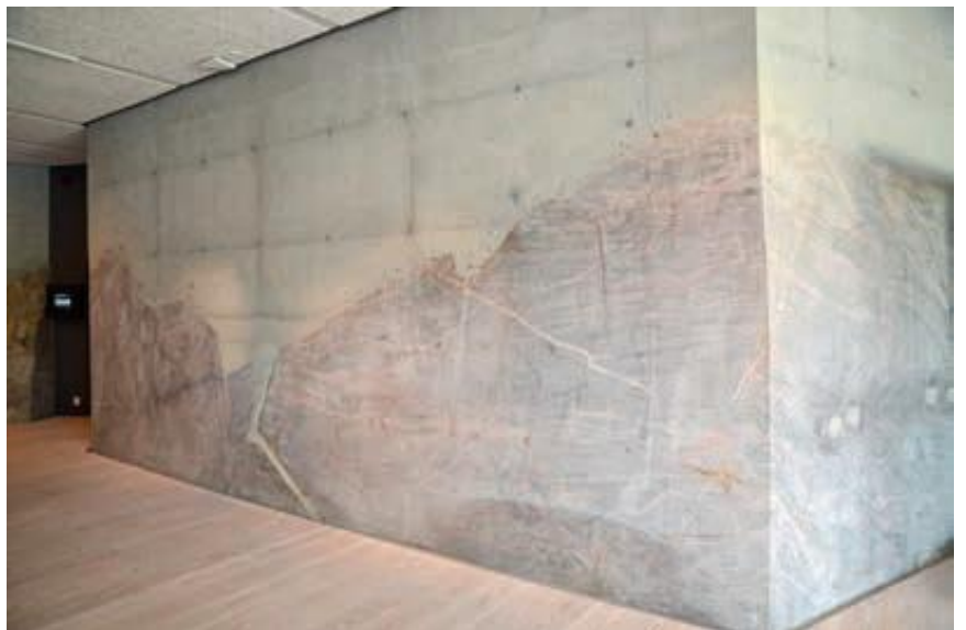
Eksponert fjell i samvirke med plasstøpt betong