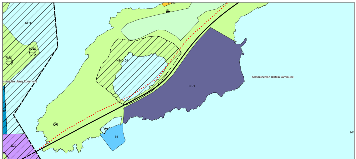
Utsnitt frå kommuneplanen sin arealdel.