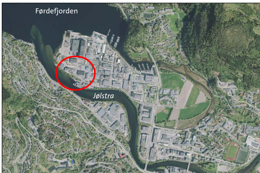
Oversiktskart, raud sirkel syner kvar planområdet ligg.