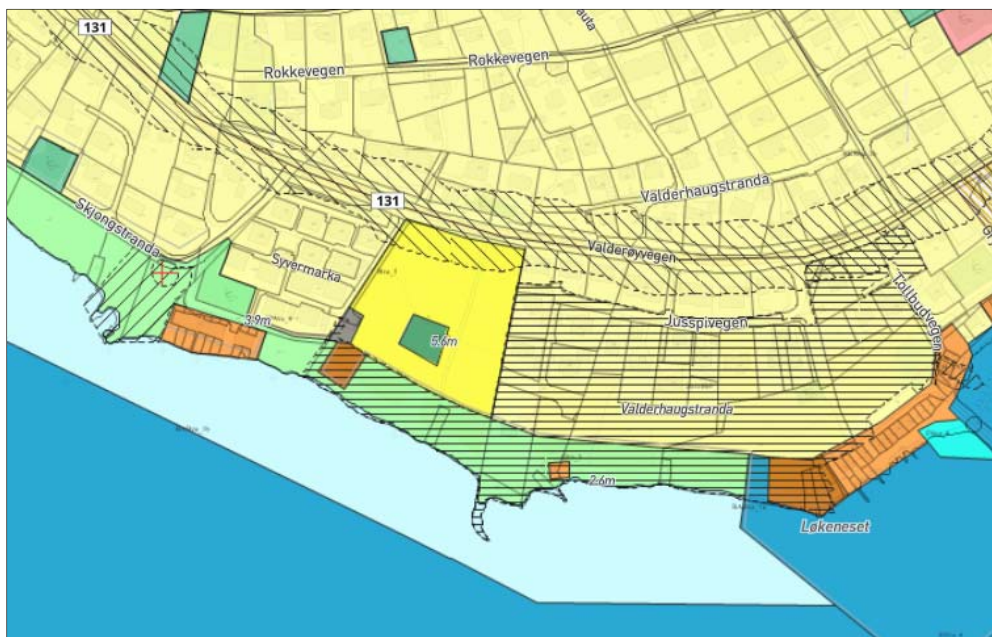
Kommuneplanens arealdel 2018-2030. Det aktuelle planområdet er lagt inn som framtidig bustadområde. Kjelde: www.kommunekart.com