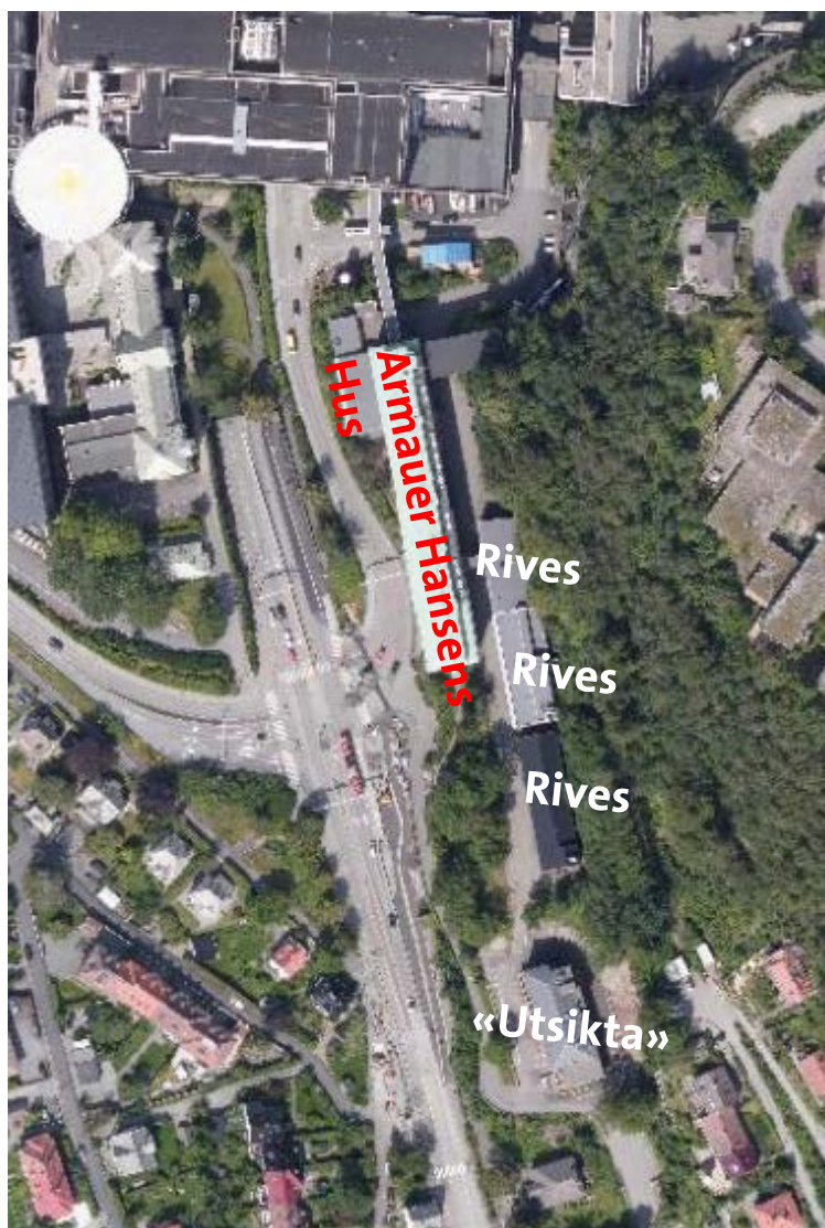
Ortofoto hentet fra Bergenskart.no.

Ortofoto av situasjonen i sørøstre del av planområdet, der nybygget erstatter bygg som rives: