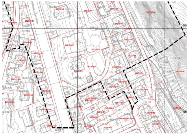
Kartutsnitt over er fra sørlig del av plangrensa, i samsvar med kommunens ønske om utvidelse her.

kunngjør i avisa når det er tid for offentlig ettersyn, i tillegg til å legge saken ut på kommunens egen nettside.