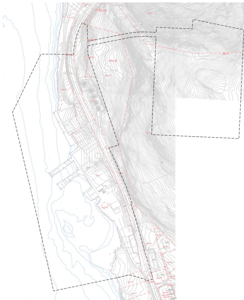
plangrense (Kan reduseres i framtiden)

Formålet med planarbeidet er å legge til rette for utfylling av sjø med etablering av industri/næringsområde, komplementering av nødvendige oppsamlingskar for tankanlegg på nordsiden av området, Det er og tenkt etablert en anleggesveg i sammenheng med tankanlegget i nord. Plangrensa dekker et totalt areal på 98,5 daa, og etter samtaler med kommunen er det kommet fram til at det er ønskelig att området som i dag er regulert til Steinbrudd og masseuttak (lilla) skal bli tatt med i reguleringsarbeidet og omreguleres om det ikke kommer motsigelser på dette.