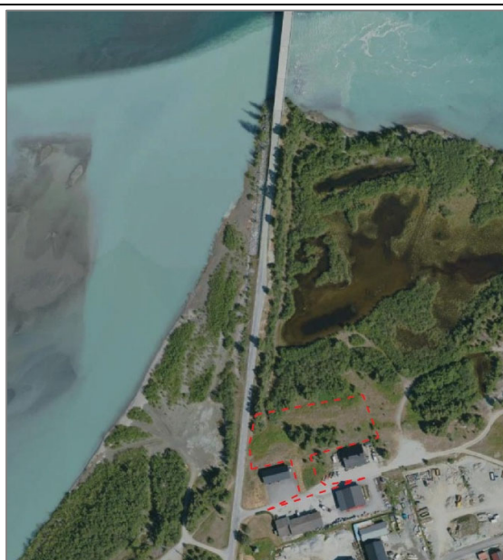
Flyfoto som viser plassering av planområdet.