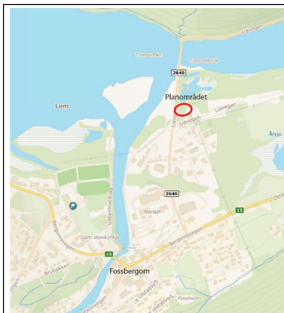
Oversiktskart som viser plassering av planområdet.

Planområdet ligg nordaust for Fossbergom, om lag 1 km frå sentrum langs Fv2640 Liavegen. Tilkomst skjer via ein sideveg frå Liavegen. Området er ikkje opparbeidd med bygnader og anlegg og har i dag arealbruk som open fastmark.